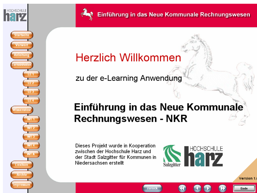
Abbildung: Lernsoftware Niedersachsen

Zentrale Zielstellung der Lernsoftware ist es, auf über 400 visualisierten Seiten grundlegende Kenntnisse zum Reformprozess des kommunalen Rechnungswesens zugeschnitten auf die besonderen Bedingungen des Landes Niedersachsen zu vermitteln.